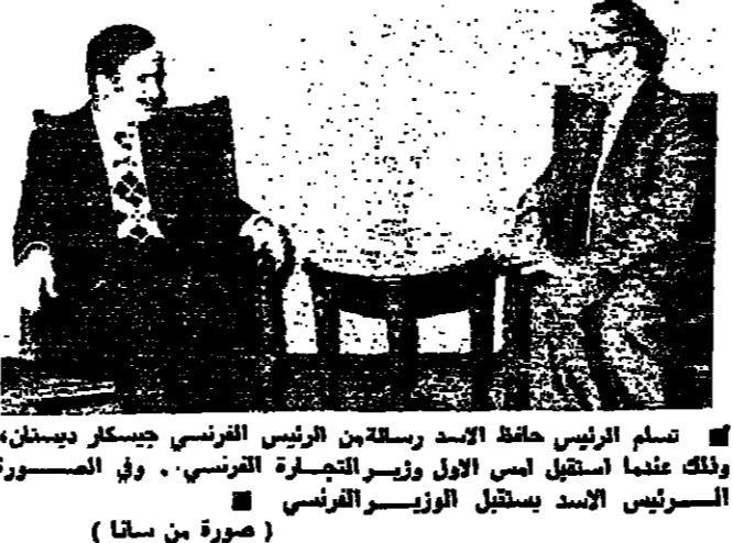
رسالة من دمشق